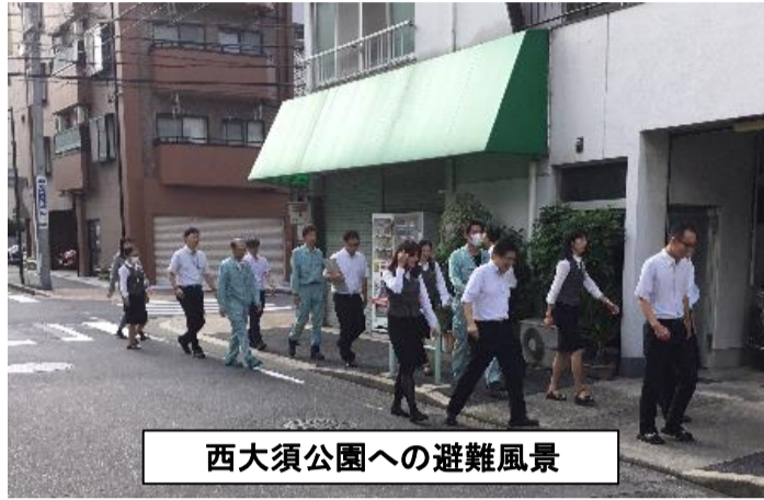
西大須公園への避難風景

就業時間内に震度5強の地震発生と1階・キッチン付近よりの出火を想定。あらかじめ決められた担当、手順に従って非難の開始、消防、近隣への連絡の後、1次避難場所である「どんぐり広場」では安全が確保できないことを想定し、各自安全を確保しながら、2次避難場所である「西大須公園」へ避難し、避難者の安否確認を行いました。